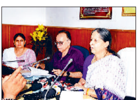
मिवाणी। नए शैक्षणिक स्तर की जानकारी देते हुए।

कर देश में अपनी अलग पहचान बनाई है और यह विश्वविद्यालय रोजगार पर गुणवत्तापूर्ण संस्कारी शिक्षा प्रदान करने को पूर्णतया कृत संकल्पित है यह विचार चौधरी बंसी लाल विश्वविद्यालय