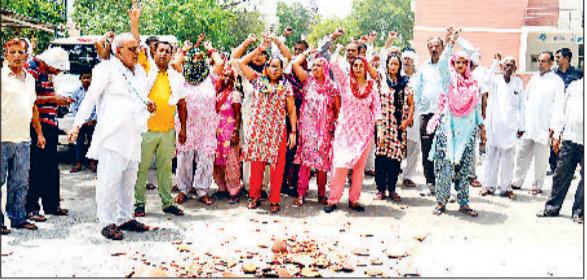
मिवाणी। एक्सईएन कार्यालय के बाहर मटका फोड़ प्रदर्शन करते बैंक कॉलोनीवासी।

दो माह से करीबन 400 घरों में बनी पेयजल किल्लत: रणसिंह हरिभूमि न्यूज ►► मिवाणी